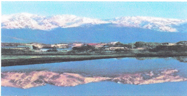
新潟産コシヒカリの里 春先水田風景