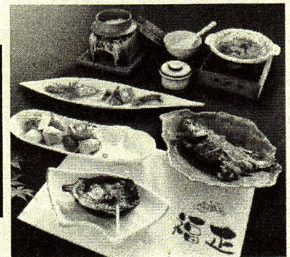
福正 海鮮ランチイメージ ※写真はイメージです。天候・仕入状況によって多少変更となる場合がございます。